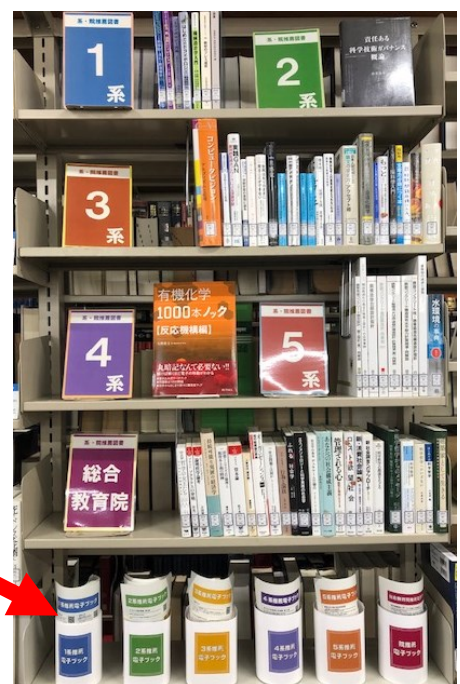
電子ブックの案内はご自由にお持ちください